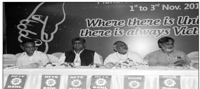
Dias View of Delegate Session