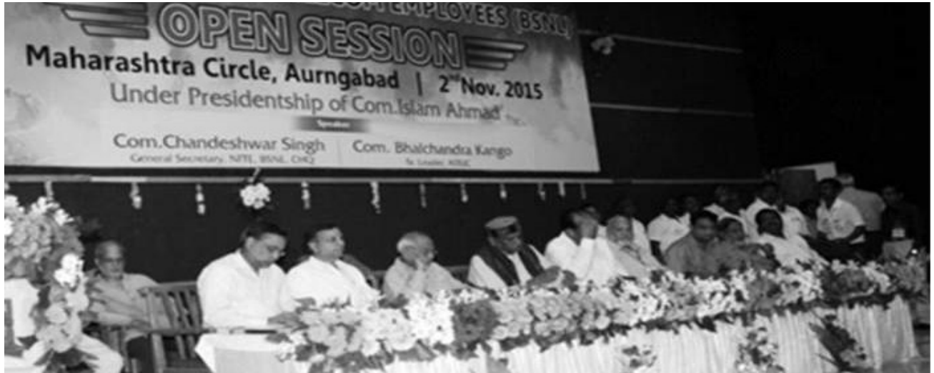
Dias View of Open Session