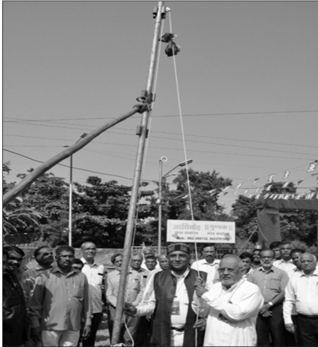
President & GS together hoisting the Union Flag