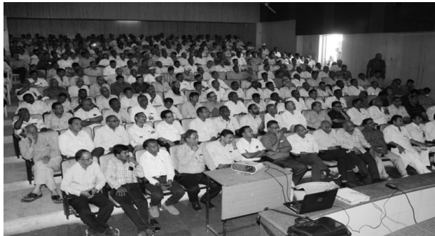
Open Session Audience