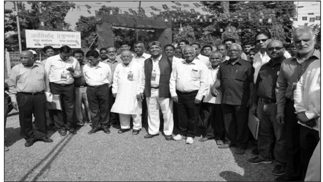
Assembled participants for Flag Hoisting Ceremony