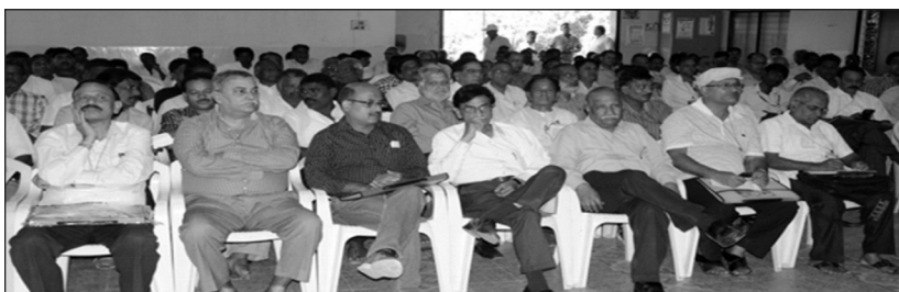
Delegate Session View